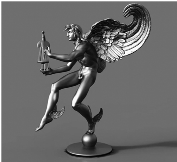
Ил. 1. Кайрос

или самоиронией. Не следует ожидать от этой книги пафоса высоких откровений — скорее это попытка облечь общечеловеческие эмоции и духовные проблемы в плоть личного опыта, подчас трагикомического и гротескного.