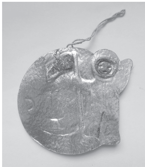
Илл. 9. Картонажная елочная игрушка «Космонавт с красным флагом на Луне». Художник Лариса Зиновьева, 1969 год.

«Космическую» елочную игрушку приобретали, если она хотя бы относительно удовлетворяла эстетическим запросам, была достаточно дешева или когда просто не было другого выбора. Но никакой устойчивой связи домашней елки с космическими достижениями государственного уровня игрушка не создавала. Более того, располагавшаяся – в соответствии с канонem – выше уровня глаз ребенка и не очень визуально привлекательная, она, как правило, игнорировалась своей основной целевой аудиторией – детьми (есть некоторая ирония в том, что среди причин этого сбоя трансляции идеологии через елку – советская педагогика и плановая экономика).