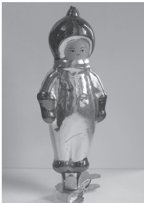
Илл. 3. Стелянная елочная игрушка на прищепке «Космонавт», 1960-е годы.

космонавты, которые изображались похожими на свои газетные фотографии – это собаки Лайка, Белка и Стрелка.