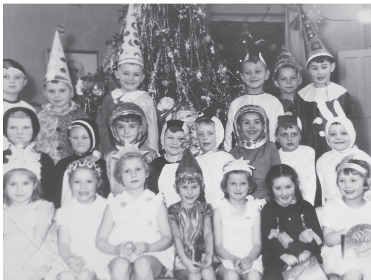
Илл. 4. Космонавты среди других традиционных «масок» карнавала в советском детском саду. В руках у девочек в правом нижнем углу – новогодние подарки с изображением ракеты.