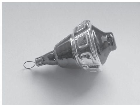
Илл. 1, 2. Ракета в технике свободной выдувки с припайными элементами и спутник «Луна» в технике формовой выдувки 30 .

Стилизация и обобщение – результат не только технологических, но и стилистических трендов этого периода. Не случайно в советской открытке, где рисунок допускал любую степень детализации, прослеживается та же тенденция: если в 1958–1961 годах космическая техника и космонавты (пока воображаемые) изображались максимально подробно и «реалистично», то с 1962-го по 1975-й господствует декоративность изображения, условность и обобщение. Технические подробности вернутся в открытку в конце 1970-х, но с елочной игрушкой этого не произойдет – по всей видимости, из-за «космической» стоимости такой детализации.