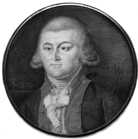
Ил. 1. Портрет неизвестного офицера армейской пехоты (1792) — гипотетический портрет Ф. В. Каржавина

единственной аргументированной и продолжает вызывать споры, поскольку есть с чем спорить 1 .